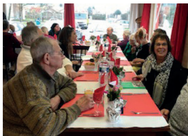
Repas de Noël organisé par l'AVAD le 24 décembre en collaboration avec Les Petits Frères des Pauvres