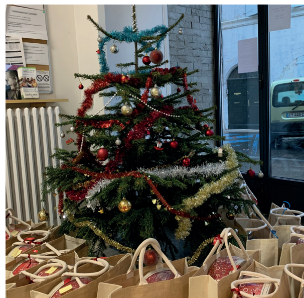
Distribution de paniers cadeaux